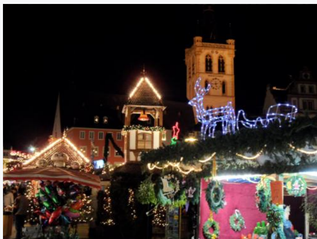
Die TOP-TEN der Weihnachtsmärkte in Europa

sind: Basel, Budapest, Posen, Wien, Brüssel, Trier, Dresden, Madeira, Tiflis und Manchester. In Trier besteht Hoffnung für den 42. Weihnachtsmarkt 2021 auf dem Hauptmarkt, Domfreihof und Viehmarkt.